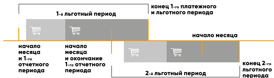
Схема льготного периода

Отчетный период — это период, в течение которого держатель карты совершает покупки. По истечении отчетного периода банк определяет сумму задолженности.